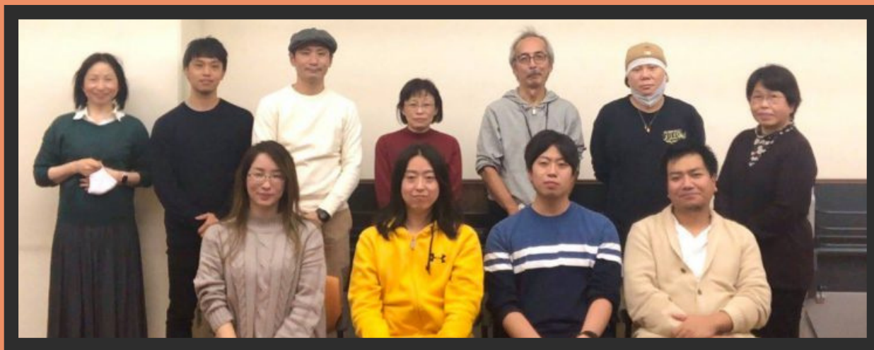
▲第3回リカバリーカレッジおおた@大田区立消費者生活センター（2020年11月27日実施） 運営メンバーと参加者のみなさんと記念撮影 新型コロナウイルス影響後の経験の語り合いをしました